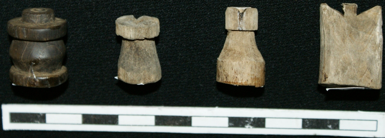
Игры. Шахматные фигуры. Слева – костяная, остальные – деревянные.