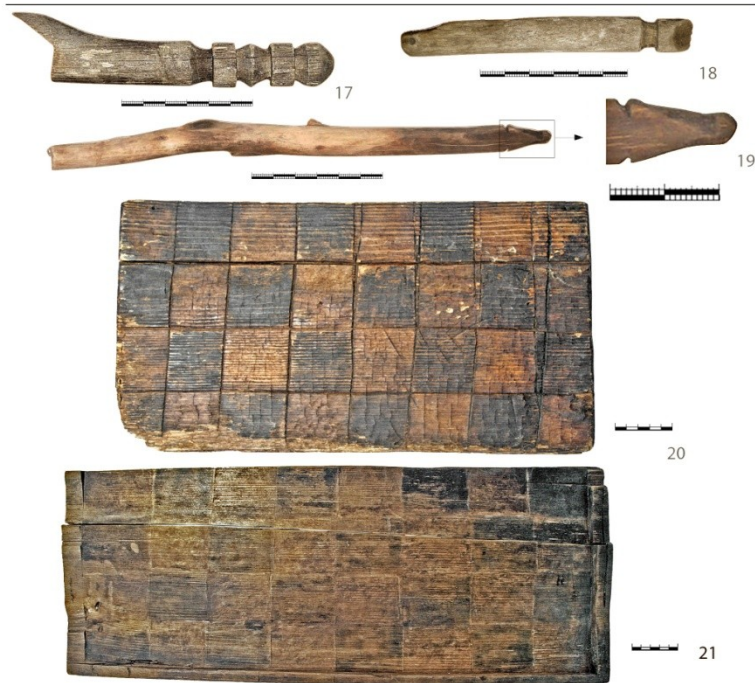
Рис. 2. Костяные фигуры. Заготовки фигур. Шахматные доски.