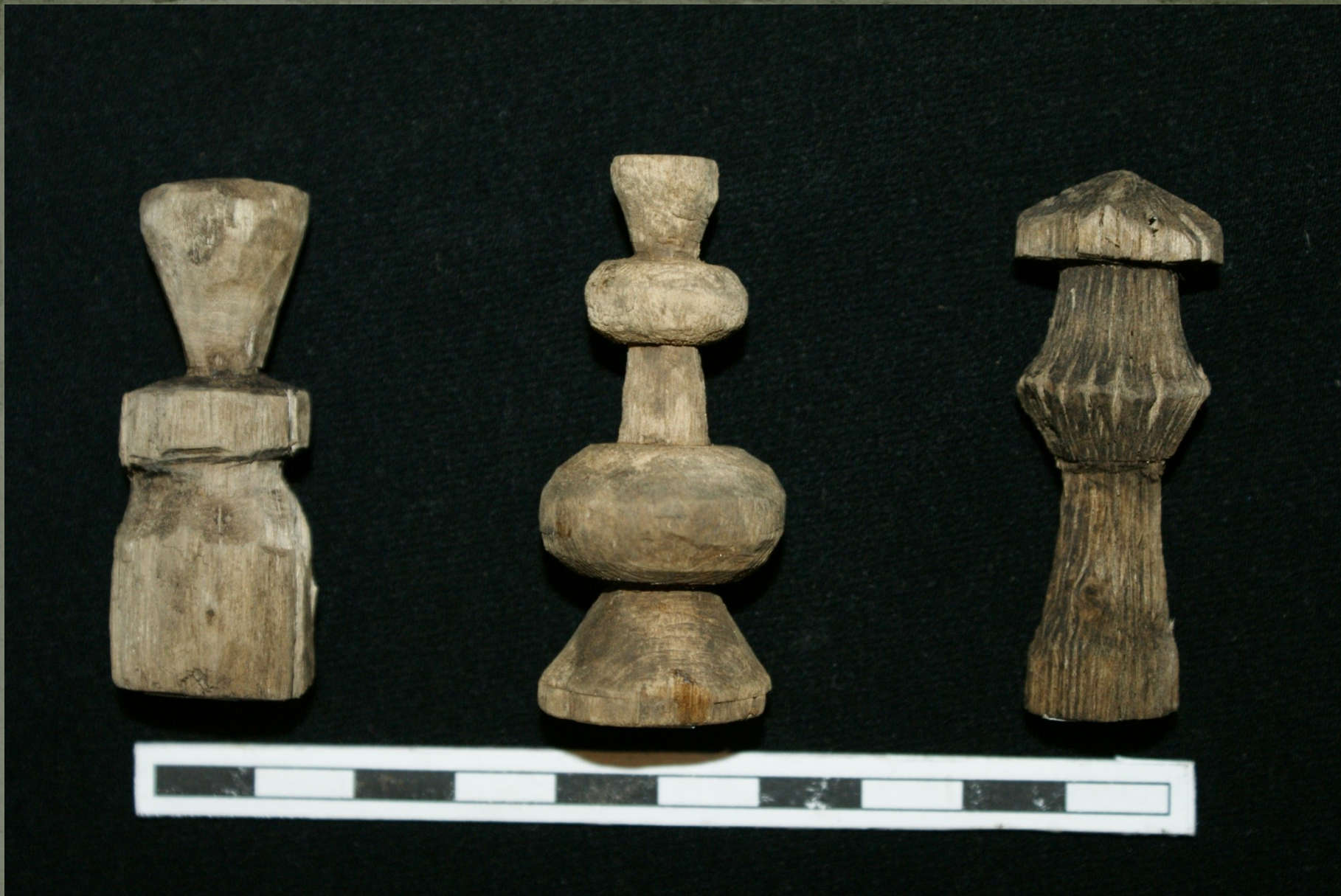
Игры. Шахматные фигуры. Дерево.