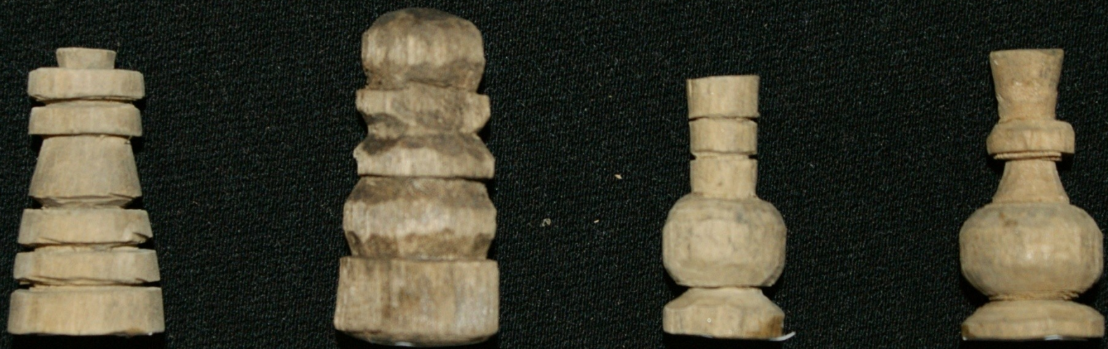
Игры. Шахматные фигуры. Дерево.